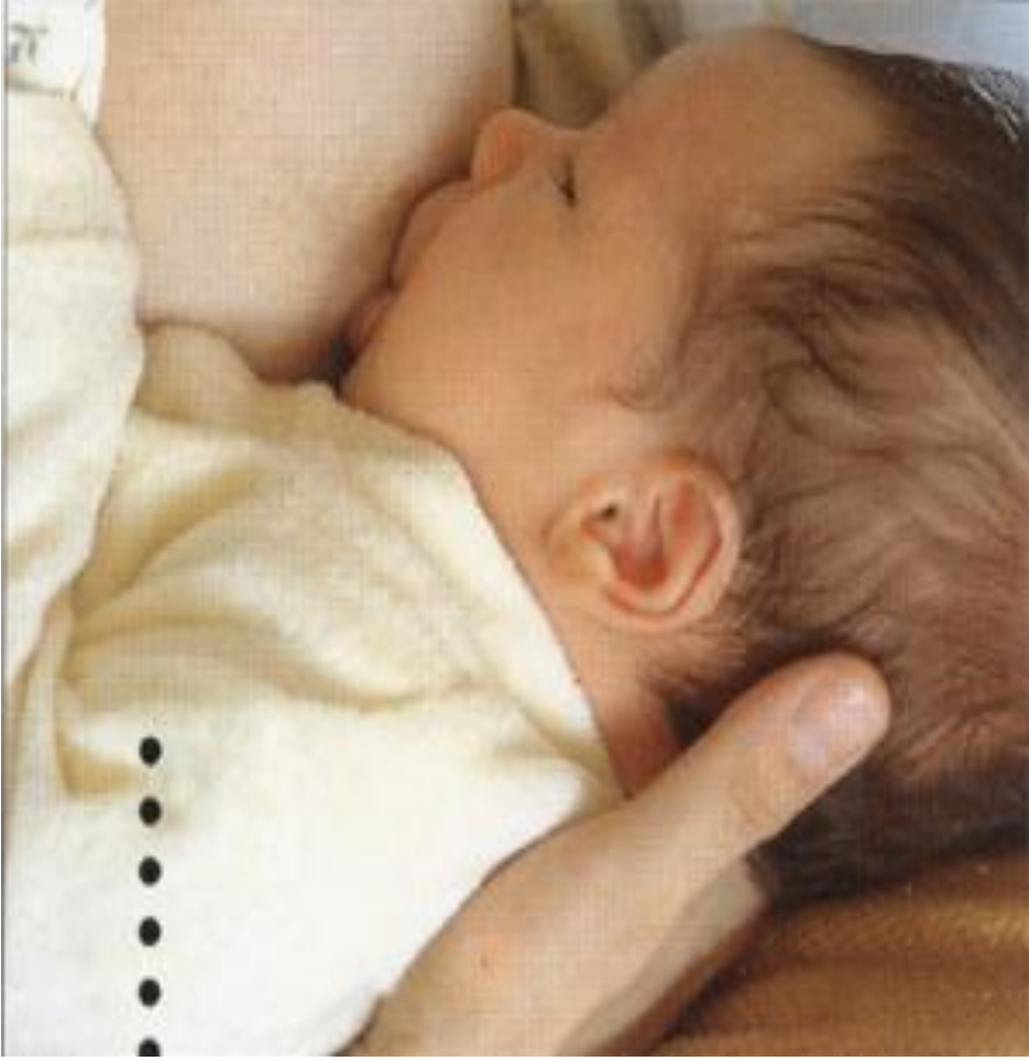
Sezeryan doğum yapan, göğüsleri büyük olan anneler için idealdir. FUTBOL TUŞU