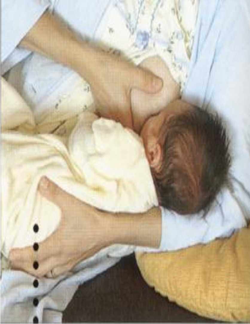
Sezeryan doğum yapan ve geceleri emziren anneler için idealdir. YATARAK EMZİRME