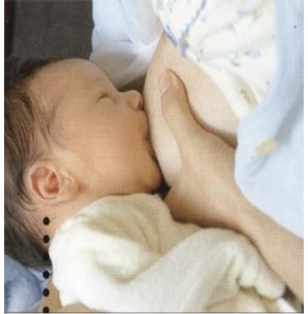
En yaygın emzirme pozisyonudur. KLASİK BEŞİK TUTUŞU